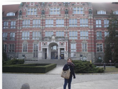
Devant le bâtiment principal de l'université

A la faculty de Management et d'Economie on choisissait nos cours selon un planning délivré en début d'année. A nous d'accorder au mieux nos cours, avec nos préférences et nos disponibilités. L'année se découpe en 2 semestres, comme en France. Le niveau d'exigence est, je trouve moins, élevé qu'en France. Il faut cependant savoir travailler à temps pour valider les examens.