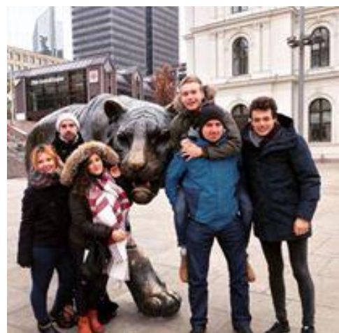
Devant la gare centrale d'Oslo