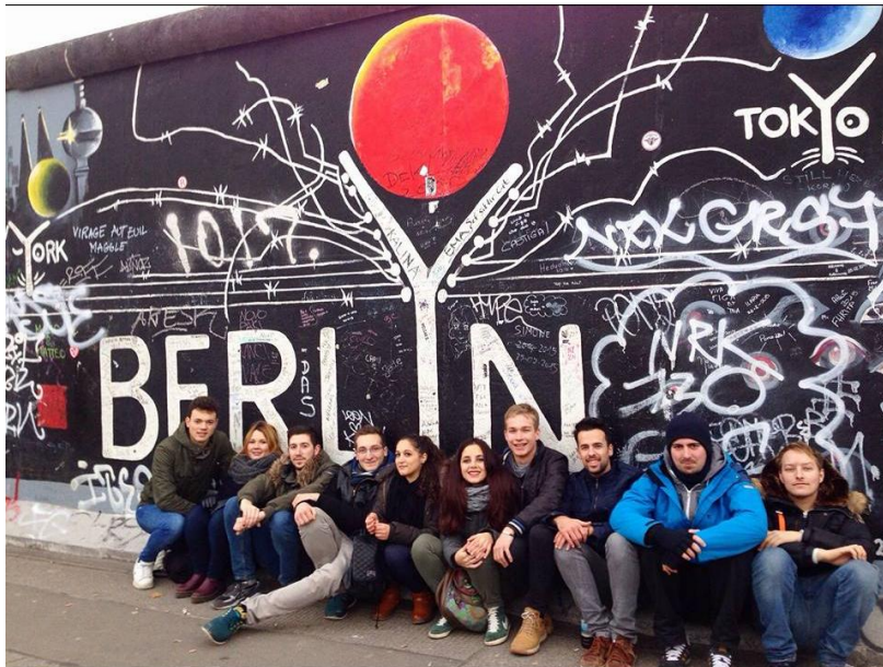
Notre « team » Erasmus en week-end à Berlin devant le mur