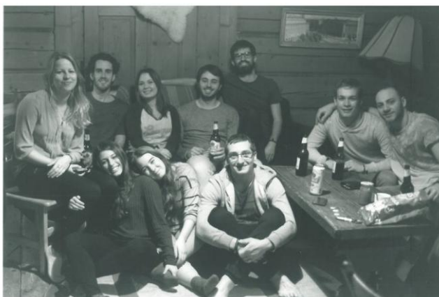
Photo du groupe dans notre auberge de jeunesse à Zakopane